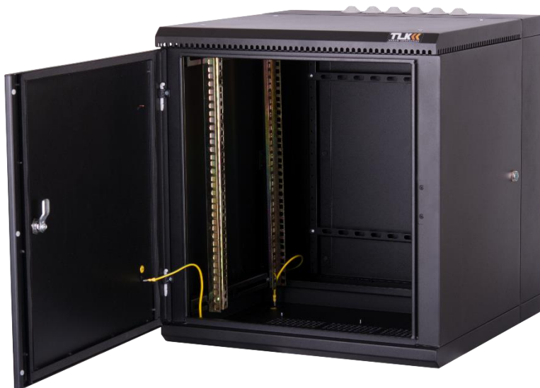
Рис.1 Общий вид шкафа TWM